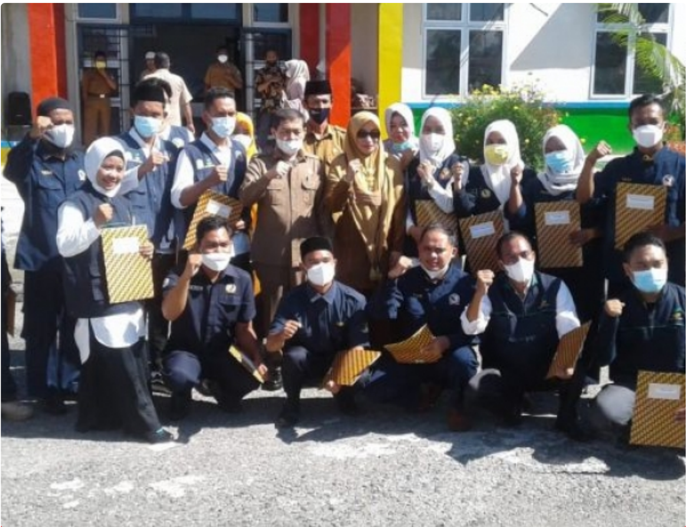
Gambar : Sekda Aceh Tenggara Foto Bersama 16 Anggota TKSK